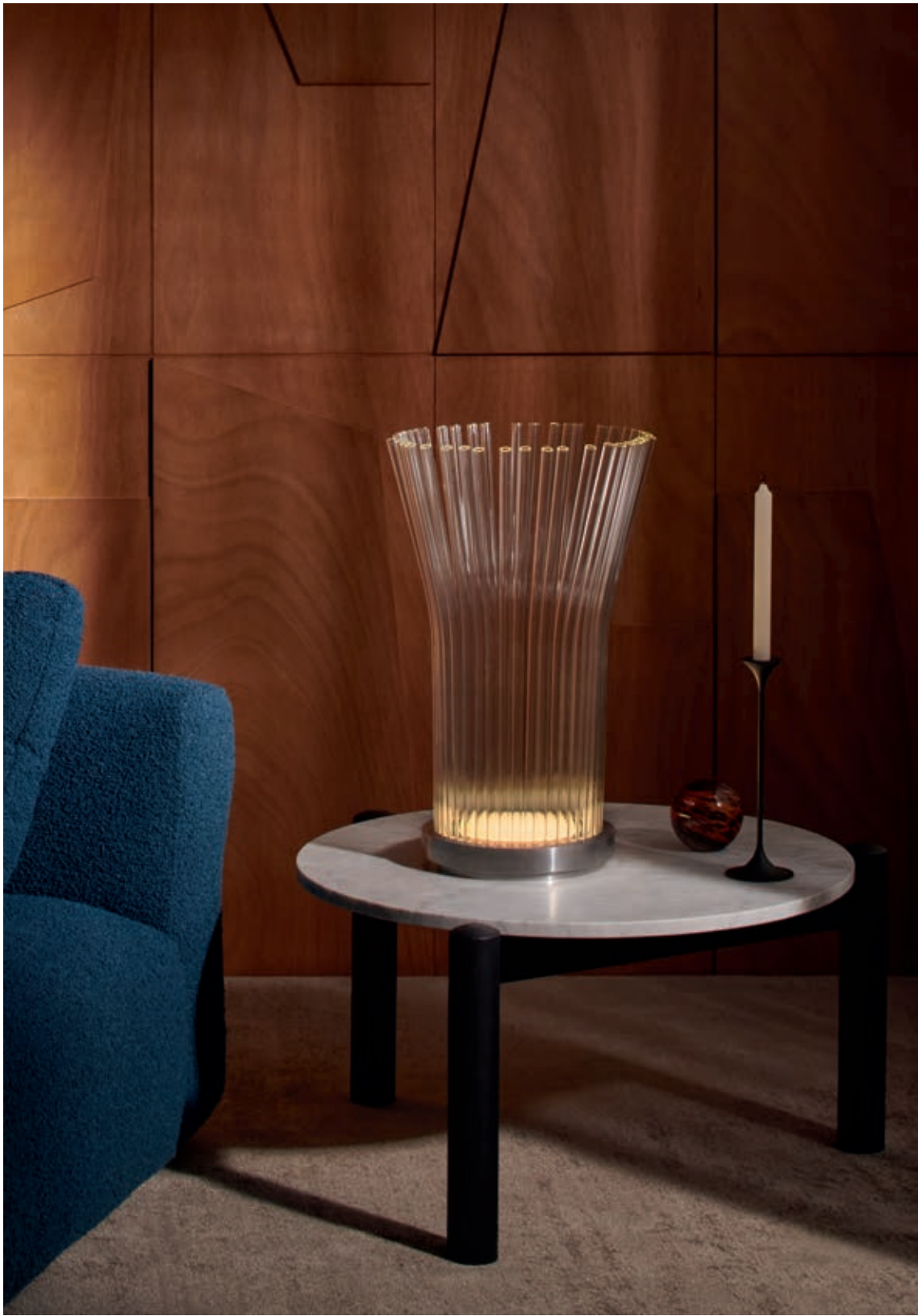
VALOR.S, Philippe Starck