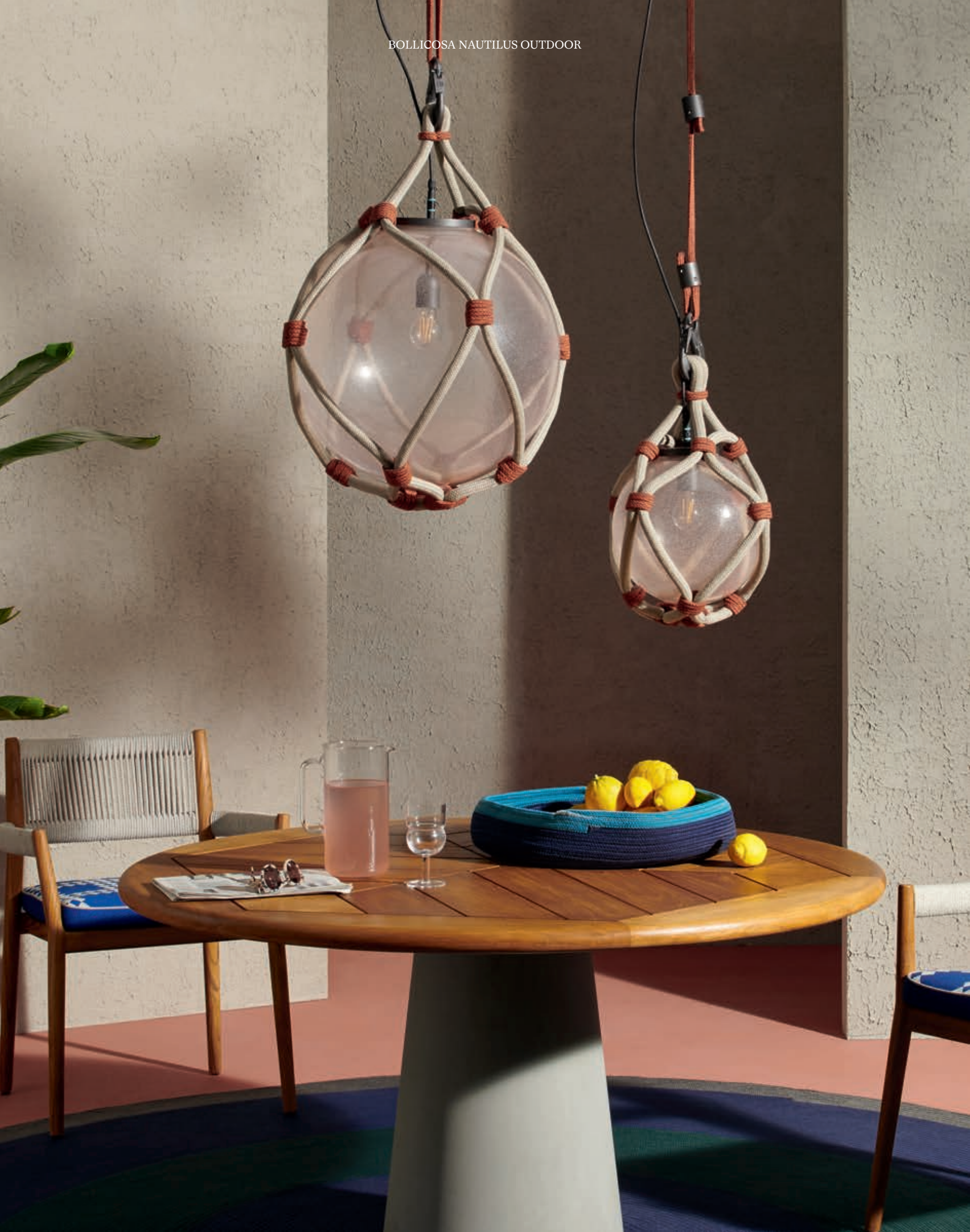
BOLLICOSA NAUTILUS OUTDOOR