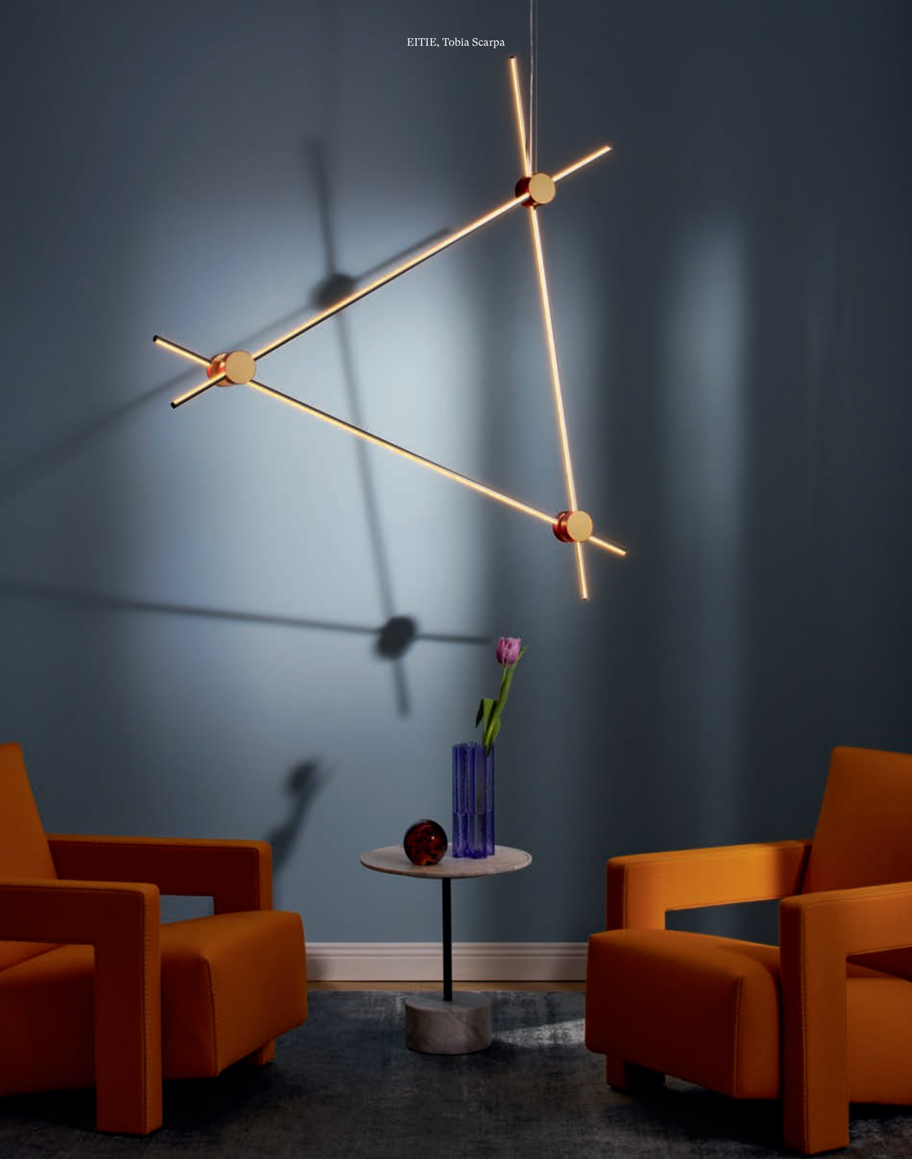
EITIE, Tobia Scarpa