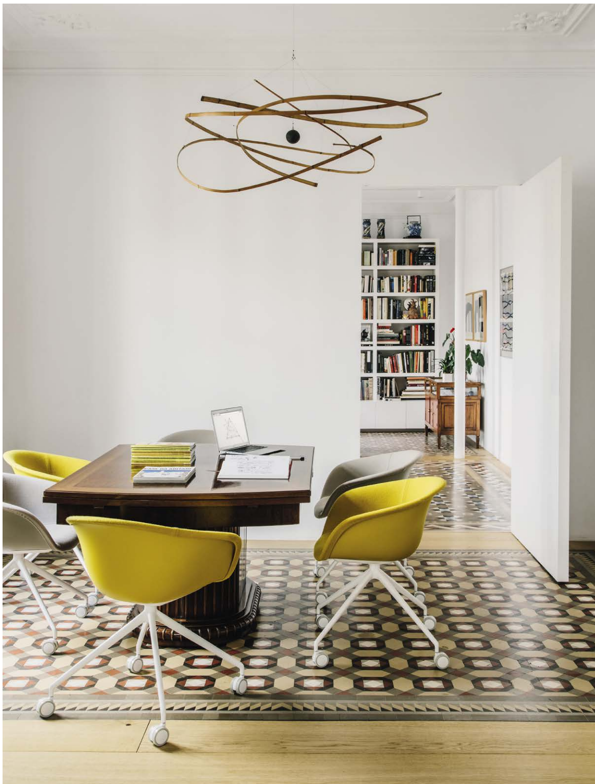
Home office Barcelona, Spain Art. 4217