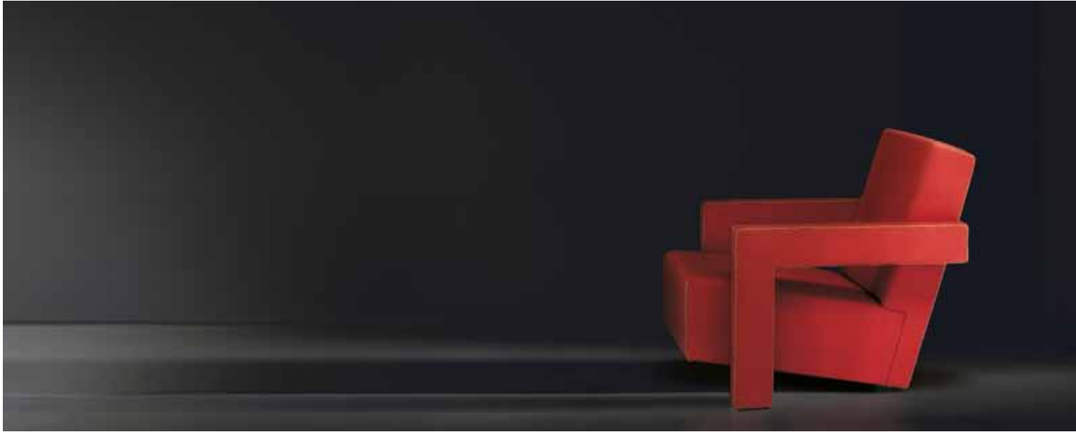
Gerrit T. Rietveld® UTRECHT

Le canapé courbe et le fauteuil ont été conçus en 1935. Un unique matériau revêt tous les composants de ce meuble, ce qui porte à mettre en évidence plus les contenus formels de langage que les caractéristiques techniques du produit. En harmonie avec l'esprit de liberté, de changement et d'innovation de Rietveld, à côté des modèles courbes, on propose aussi deux versions de canapé avec assise et dossier droit.