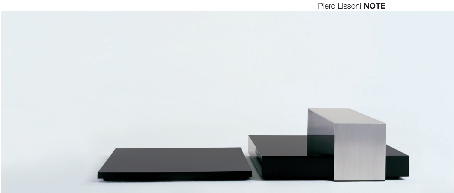
Piero Lissoni NOTE