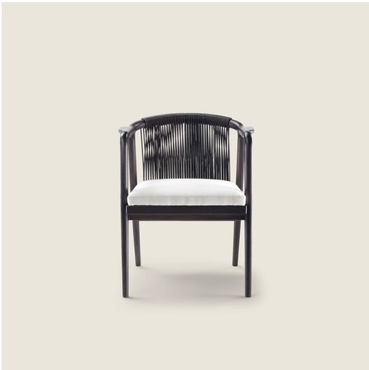
CRONO ANTONIO CITTERIO 2015 ARMLEHNSTÜHLE/STÜHLE